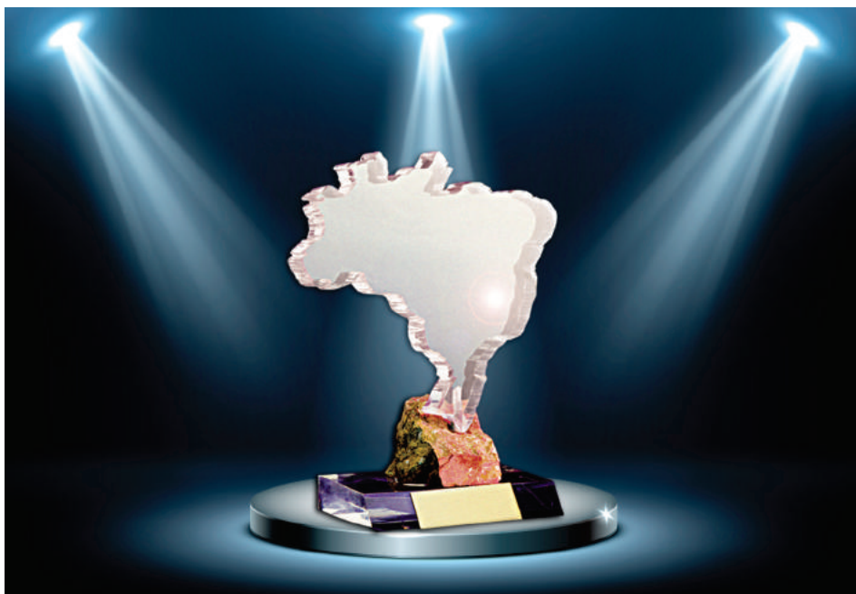
Prêmio conquistado pela Serra Verde valorizou o potencial econômico e ecológico do projeto

O desenvolvimento de rota de processo menos poluente e de menor custo para aproveitamento de minerais de terras raras colocou a Mineração Serra Verde em evidência no setor mineral de todo o país. O processo se destacou pelo potencial inovador e tecnológico e proporcionou à empresa o título de Empresa do Ano do Setor Mineral. A eleição é promovida pela Revista Brasil Mineral, uma das mais reconhecidas do país, que há mais de