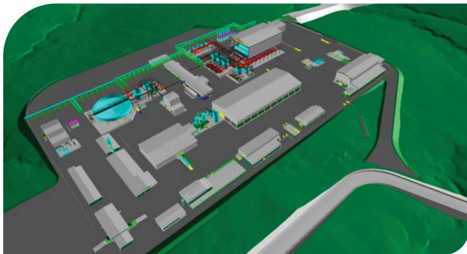
Tecnologia e recursos próprios viabilizaram redução da área de implantação

Ao todo, as indicadas receberam 11.696 votos.