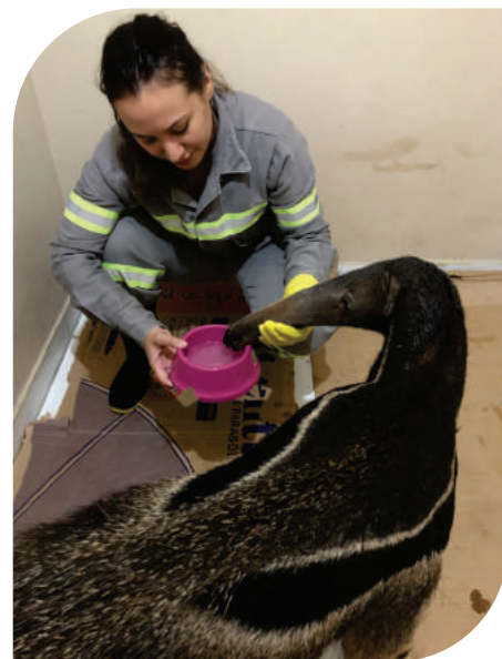
Tamanduá resgatado pela equipe do Cetras