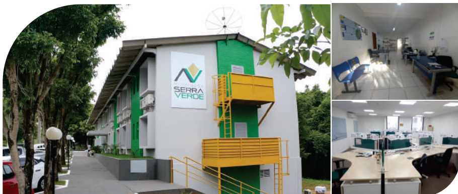
Escritórios da Serra Verde em Minaçu e um em Goiânia